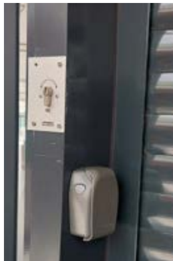
De bediening van het rolluik bevindt zich links van de sleutelkluis.