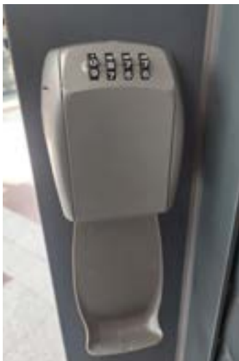
Links naast het rolluik van de WisselWinkel hangt een sleutelkluis

Is de sleutel niet aanwezig? Haal dan op vertoon van je reserveringsbevestiging een reservesleutel op bij de servicebalie van Albert Heijn. Laat deze sleutel aan het einde van de dag achter in de sleutelkluis.