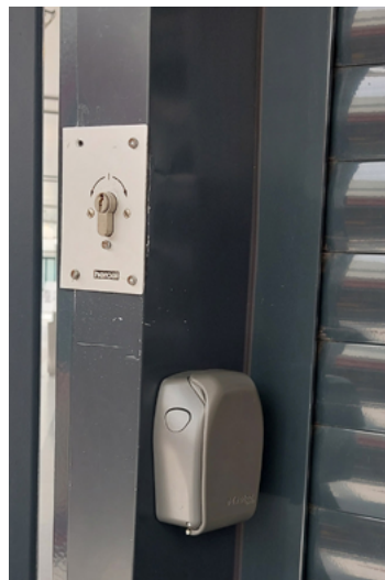
De bediening van het rolluik bevindt zich links van de sleutelkluis.