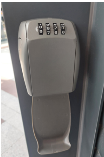
Links naast het rolluik van de WisselWinkel hangt een sleutelkluis

Is de sleutel niet aanwezig? Haal dan op vertoon van je reserveringsbevestiging een reservesleutel op bij de servicebalie van Albert Heijn. Laat deze sleutel aan het einde van de dag achter in de sleutelkluis.